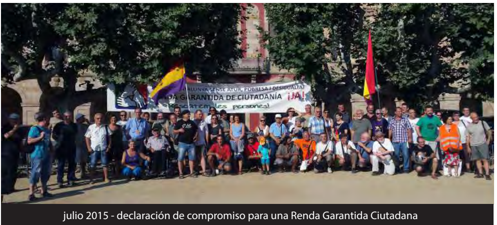
julio 2015 - declaración de compromiso para una Renda Garantida Ciutadana

Personas ingresadas en centros penitenciarios.