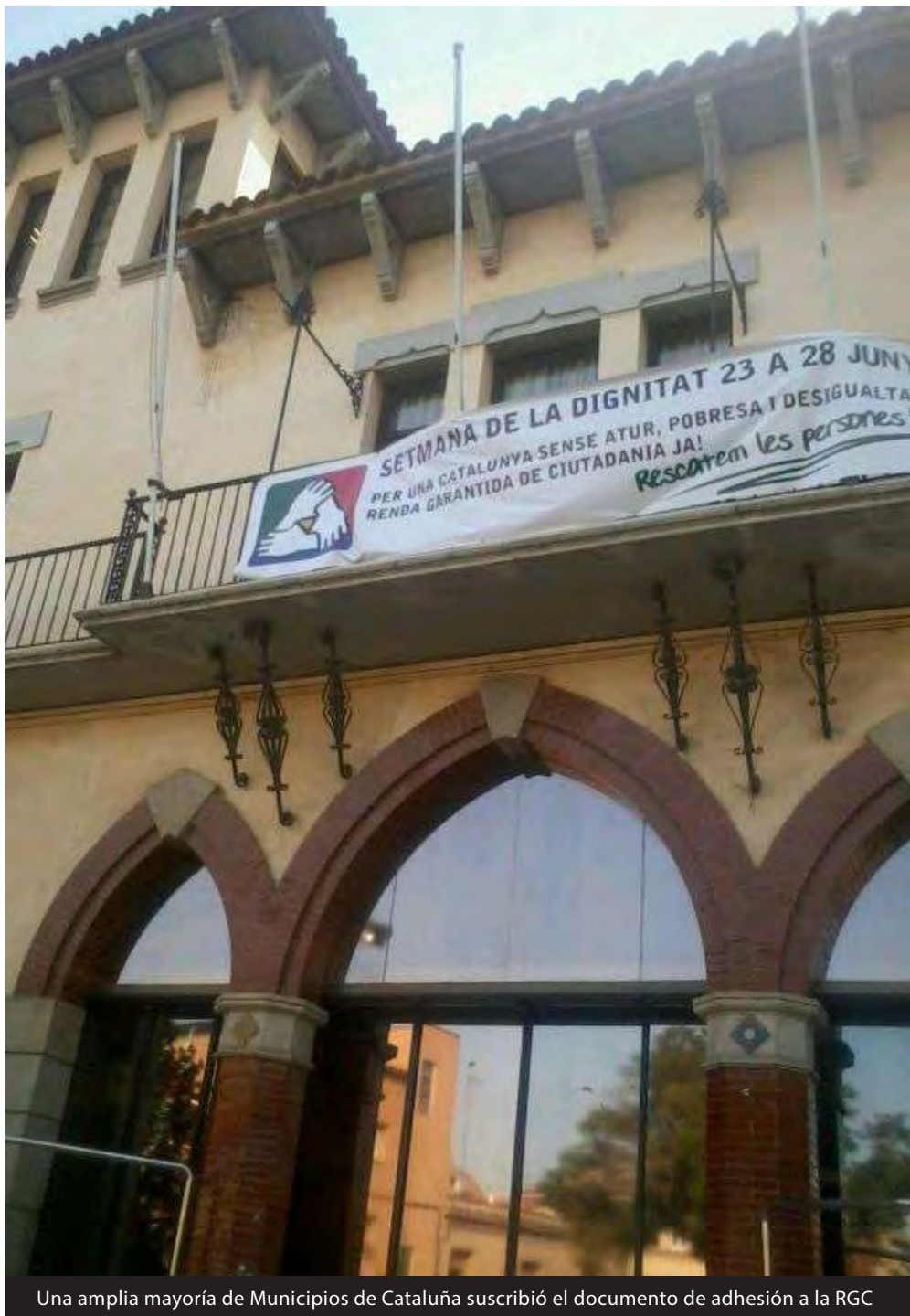
Una amplia mayoría de Municipios de Cataluña suscribió el documento de adhesión a la RGC