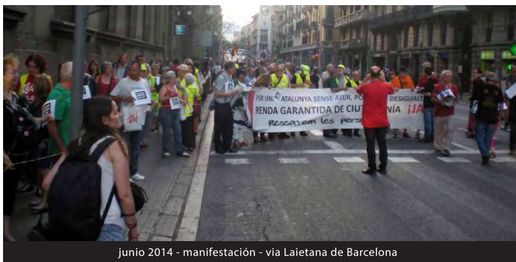
junio 2014 - manifestación - vía Laietana de Barcelona

En el caso de no poseer este carné debe tramitarlo, lo antes posible, en la Oficina de atención de asuntos sociales y familias (OAF) .