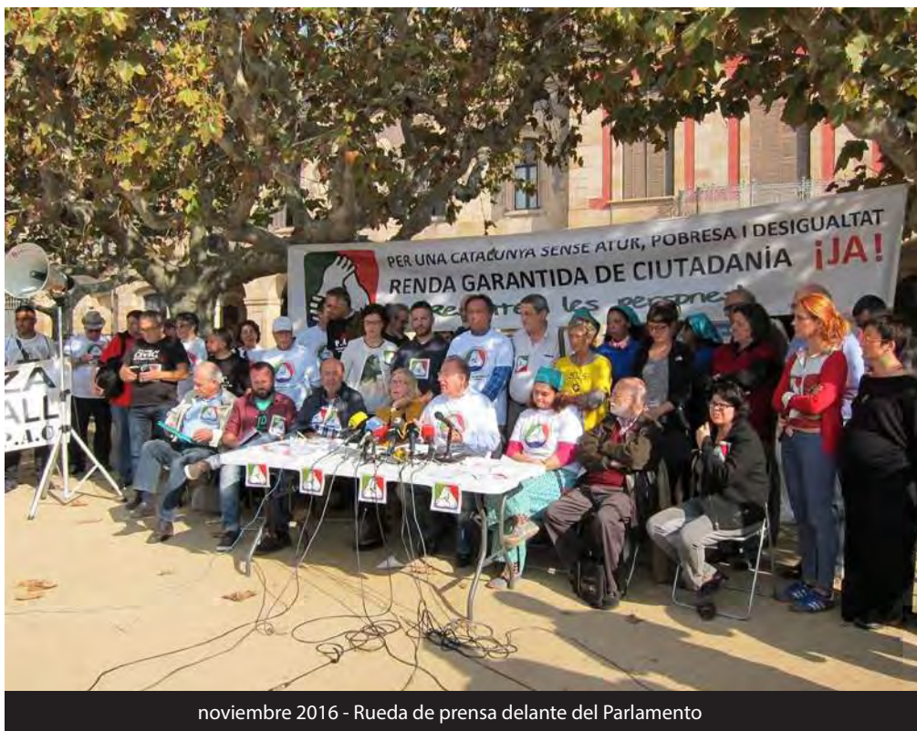
noviembre 2016 - Rueda de prensa delante del Parlamento

La relación de parentesco se cuenta a partir del titular, es decir, la persona titular de la RGC y el cónyuge o pareja estable, hijos, nietos; también padres, hermanos y abuelos de la persona titular de la RGC.