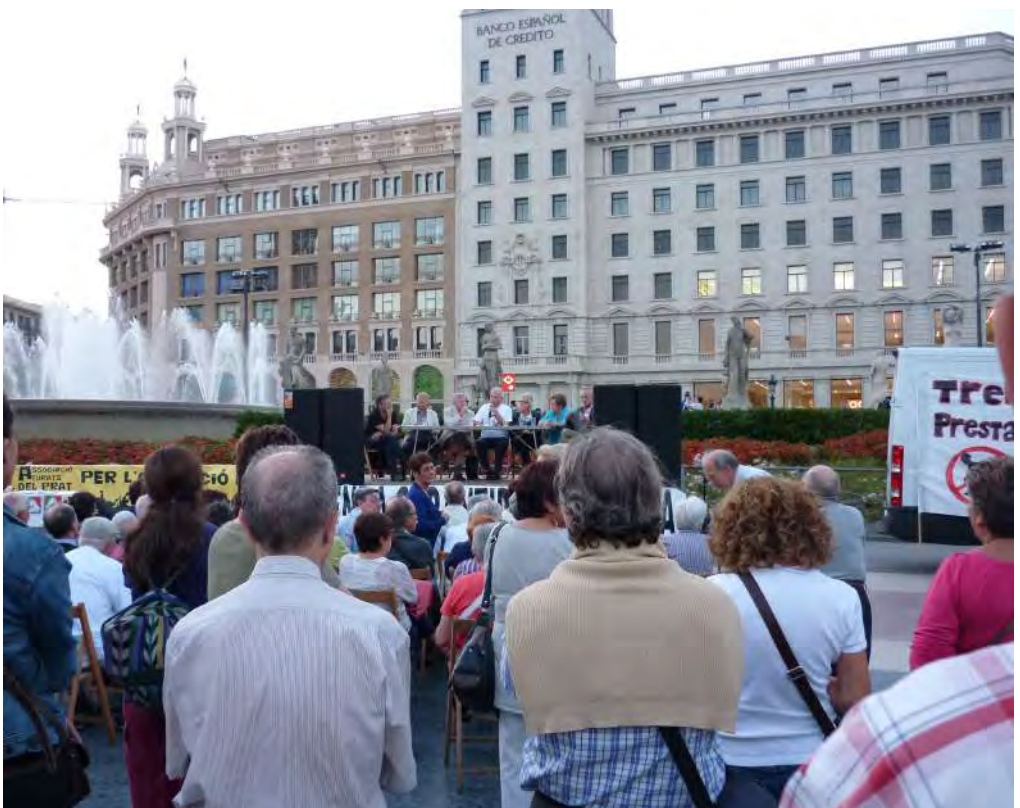
Septiembre 2013 – ayuno – plaza Cataluña

Certificado de reconocimiento de la minusvalía. si se tiene reconocida en un grado superior al 65%.