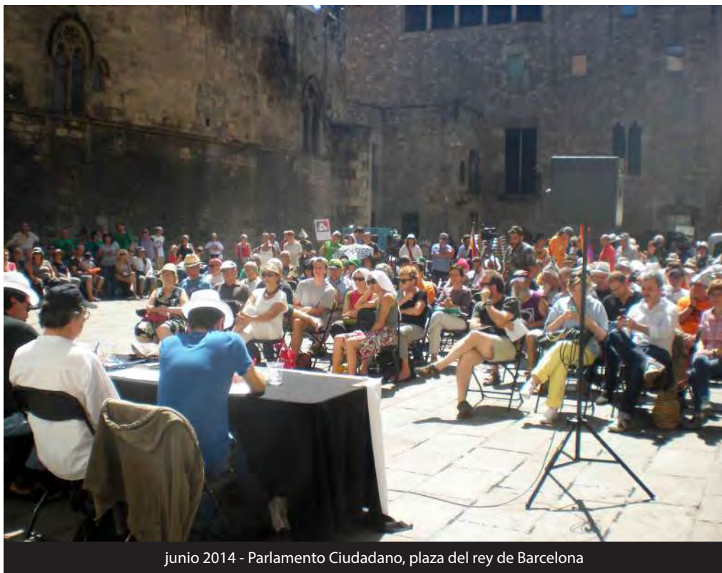
junio 2014 - Parlamento Ciudadano, plaza del rey de Barcelona